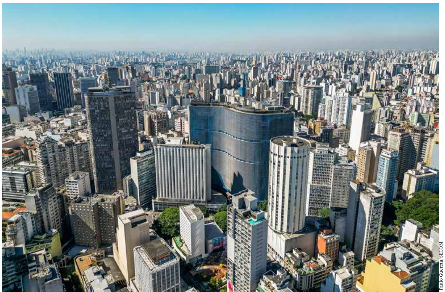
Ações do movimento #TodosPeloCentro estão transformando a região central de São Paulo com novos projetos de habitação, lazer e segurança

Com os incentivos da Prefeitura, por exemplo, desde 2021, apenas no perímetro da AIU Setor Central, foram licenciadas 14.378 novas unidades de Habitações de Interesse Social e Habitações de Mercado Popular. O Programa Requalifica Centro também está entre os projetos que concede incentivos para estimular habitação, este por meio da requalificação de prédios particulares antigos (retrofit) no centro e a transformação desses locais em unidades habitacionais ou comerciais. No âmbito do programa, desde 2023, a Prefeitura já aprovou 14 empreendimentos particulares para retrofit. Para os interessados em requalificar imóveis antigos no Centro, a Prefeitura também anunciou R$ 1 bilhão em subvenção econômica para a execução dessas obras. A