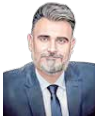
Cristiano Medina da Rocha

O fato de estar no Nordeste, onde sua aprovação está acima de 50%, é bom lembrar que o Brasil não é feito só de Nordeste. Há outras regiões em que o presidente precisa investir.