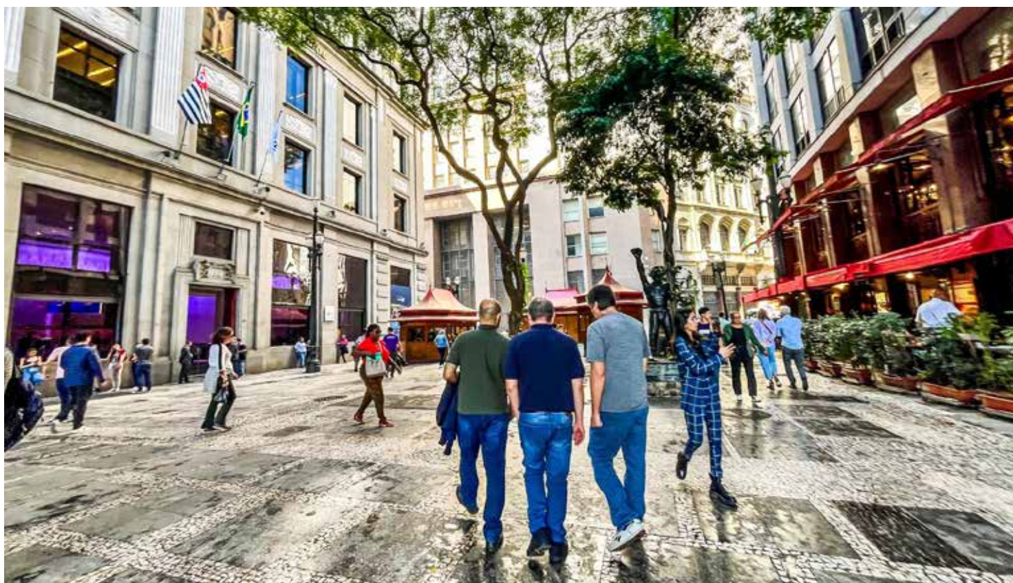
A prefeitura de São Paulo está tornando o centro da cidade um lugar ainda mais acolhedor e vibrante com diversas ações de revitalização

Se você é um apaixonado por gastronomia, prepare-se para ter seus sentidos aguçados, pois o Centro de São Paulo é um paraíso para os amantes da boa mesa. Aqui, você encontra restaurantes premiados que oferecem o melhor da