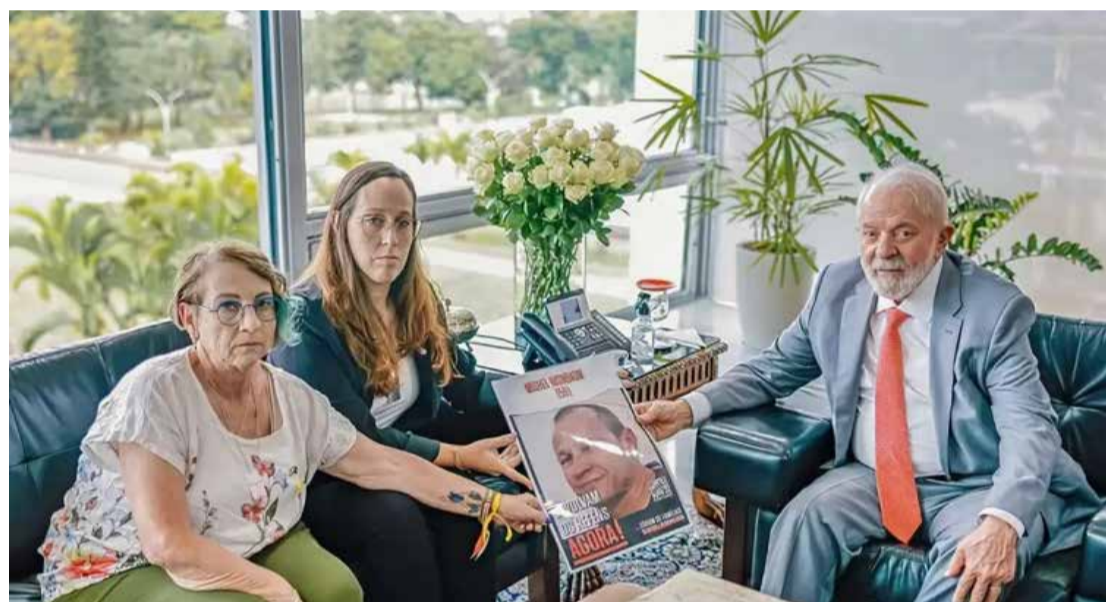
Ricardo Stuckert - PR

Em outubro passado, o Hamas, que controla a Faixa de Gaza desde 2007, lançou um ataque surpresa de mísseis contra Israel, com incursão de combatentes armados por terra, no sul do país. De acordo com autoridades israelenses, cerca de 1,2 mil pessoas foram mortas e duas centenas de israelenses e estrangeiros foram feitos reféns. Em resposta, Israel