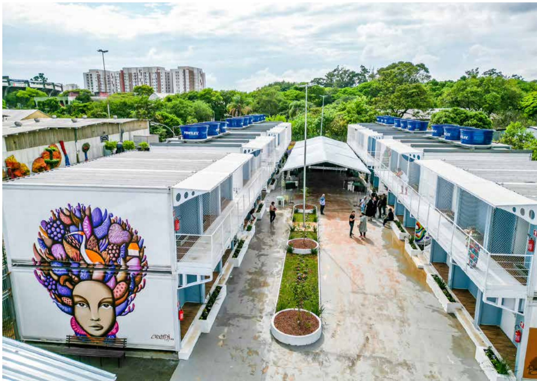
Vila Reencontro Pari, na zona norte de São Paulo, é a terceira e maior unidade do programa: serviço oferece um ambiente seguro e bem estruturado para diversas famílias em situação de rua

A Rede Socioassistencial é uma política social constituída por um conjunto de serviços, programas, projetos e benefícios que compõem o Sistema Único de Assistência Social (SUAS) e são prestados diretamente ao cidadão ou por meio de convênios com organizações sem fins lucrativos.