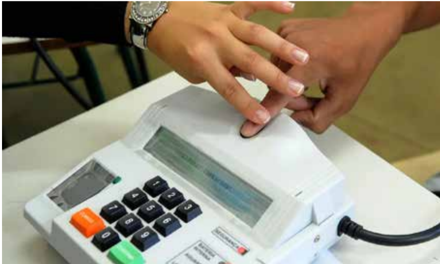
Wilson Dias - ABR

Após essa data, atendimento será presencial até 8 de maio