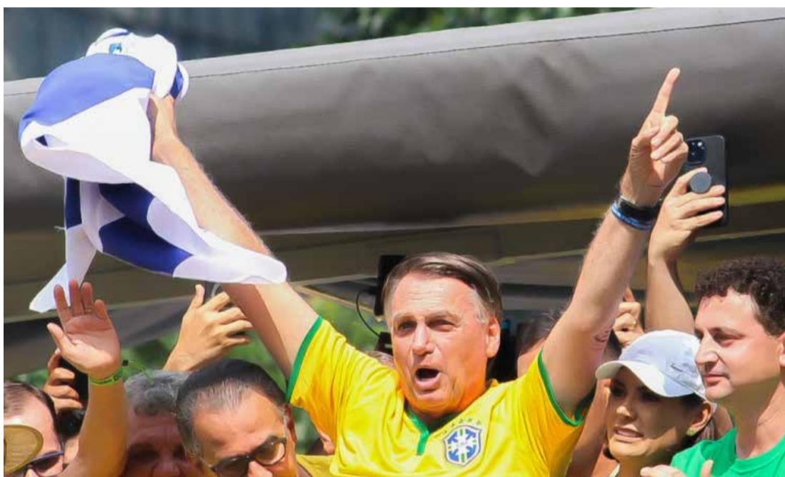
Gabriel Silva / Ato Press/Estadão Conteúdo

“Bolsonaro queria dar um golpe’. Isso desde quando assumi em 2019 ouvia e parte da imprensa reverberar. Golpe é tanque na rua e nada disso foi feito”, continuou, negando plano de tentativa de golpe de Estado – investigação que