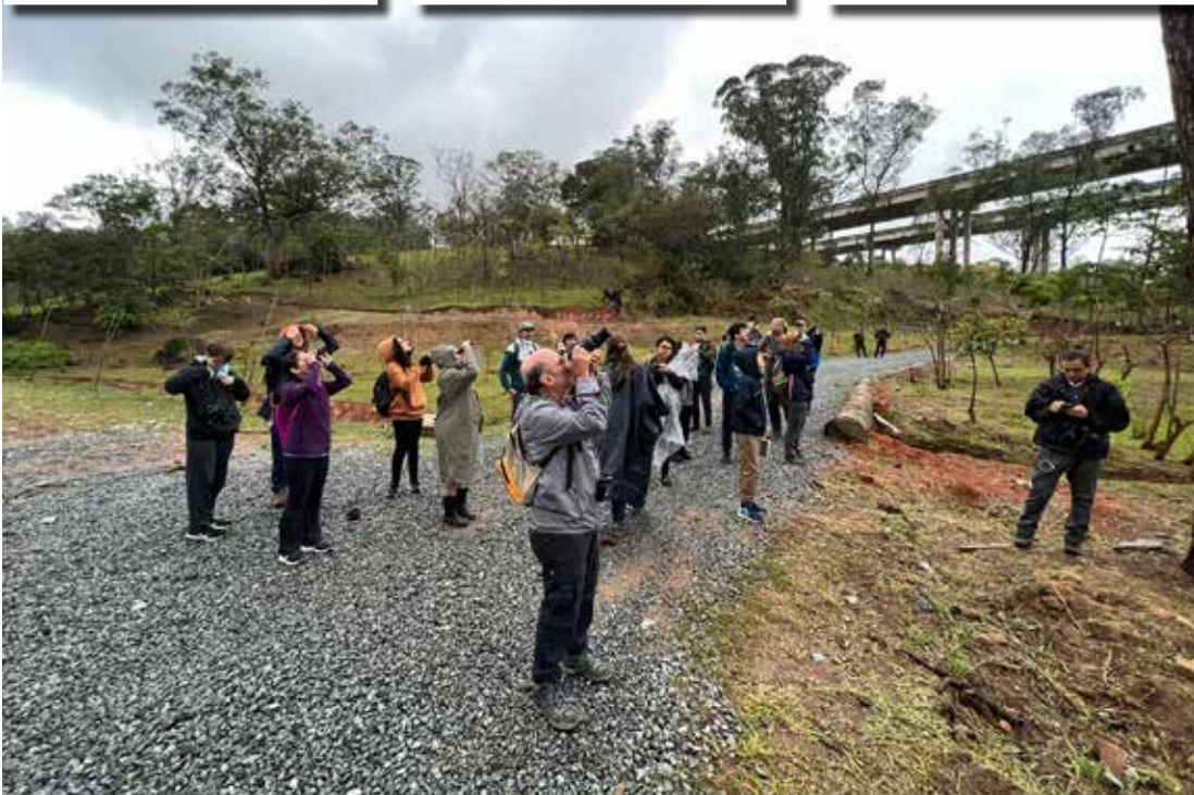
Ao final de cada edição acontece um piquenique colaborativo, que encerra com chave de ouro os eventos

O projeto “Vem Passarilhar Sampa”, da Prefeitura de São Paulo, tem atraído visitantes nos parques municipais da capital, incentivando a prática de observação de aves, criando laços com a natureza e destacando a relevância da preservação das aves em seu habitat nacional.