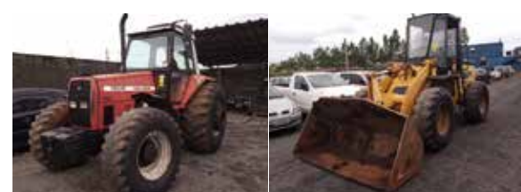
08/03/2024 - 9H | EMPRESA VENDE