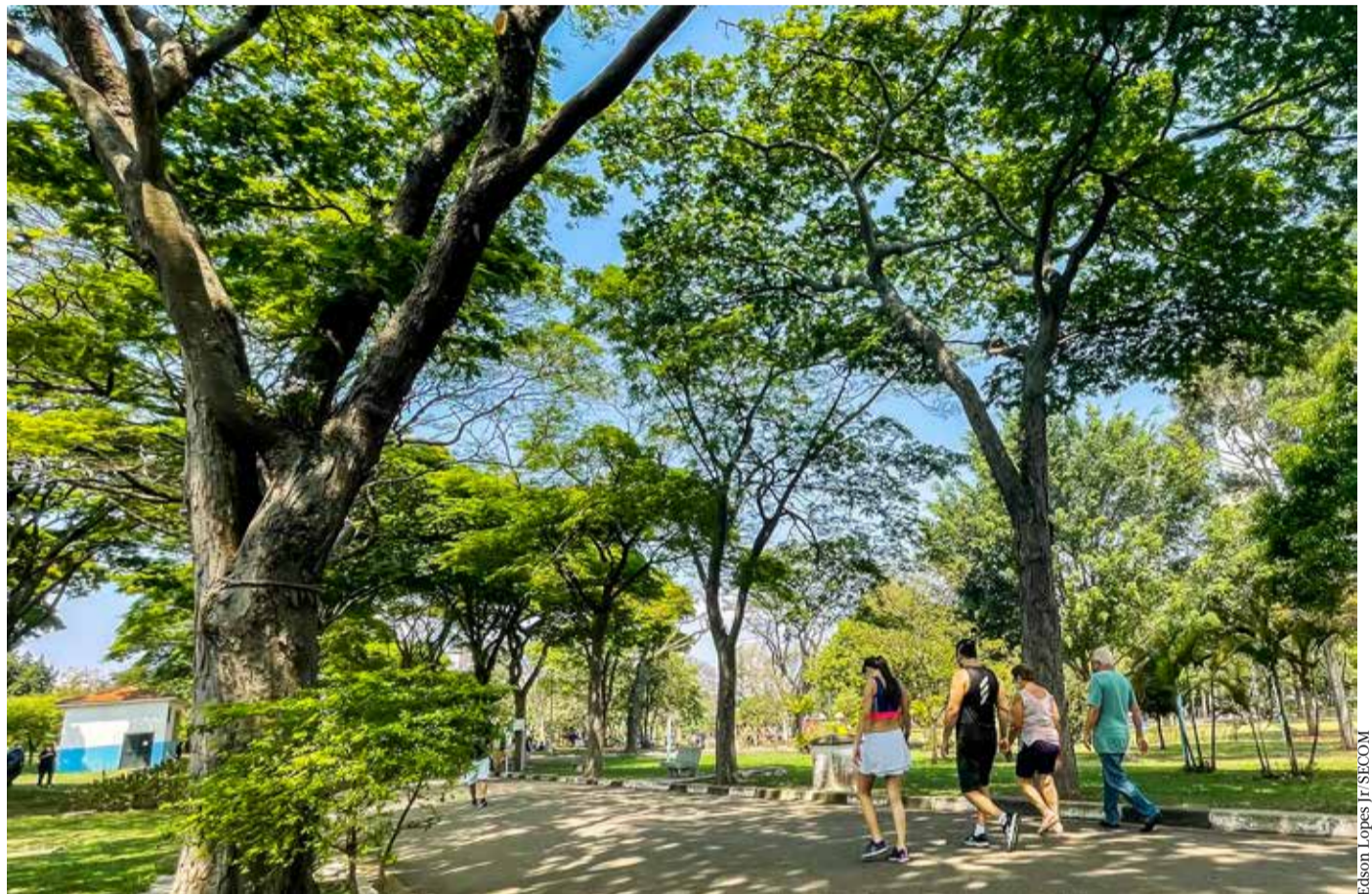
Todas as aulas e atividades dos Centros Esportivos são gratuitas e ofertadas à população de todas as idades

Conteúdo em parceria com a Prefeitura de São Paulo