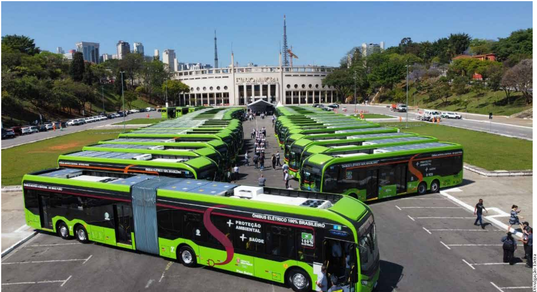
Por meio do transporte público de São Paulo, é possível chegar a qualquer lugar da cidade

Com isso, a capital paulista terá a maior frota de ônibus elétricos entre os municípios da América Latina