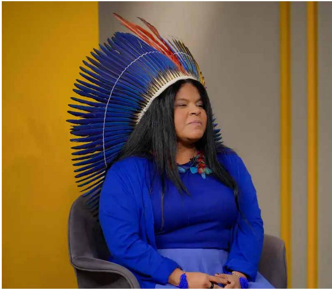
Rafael Neddemeyer/Canal Gov

Ministra permanece no hospital para fazer uma bateria de exames