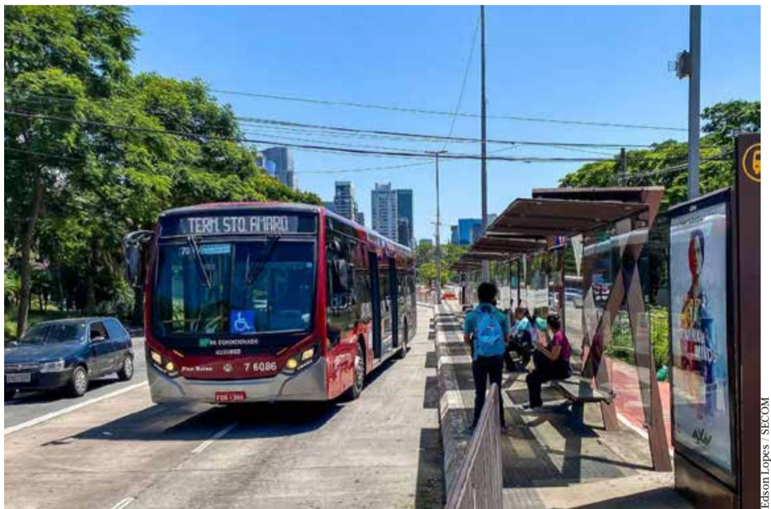
A medida da Prefeitura de São Paulo busca aumentar a eficiência do transporte público na cidade

Vale citar que o transporte coletivo municipal da cidade de São Paulo conta, diariamente, com a operação de cerca de 12 mil ônibus divididos em 1,3 mil linhas e com uma média de 7,2 milhões de embarques de passageiros, o que caracteriza esse sistema como um dos maiores do mundo.