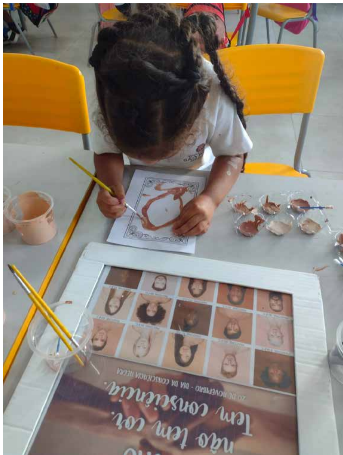
Em 2023 foram impressas mais de 29,5 mil cópias do currículo antirracista para serem distribuídas na Rede Municipal de São Paulo

No ano passado, a Prefeitura também adquiriu mais de 700 mil livros literários sobre a temática étnico-racial para compor os acervos das escolas municipais e serem distribuídos entre os estudantes por meio do programa Minha Biblioteca.