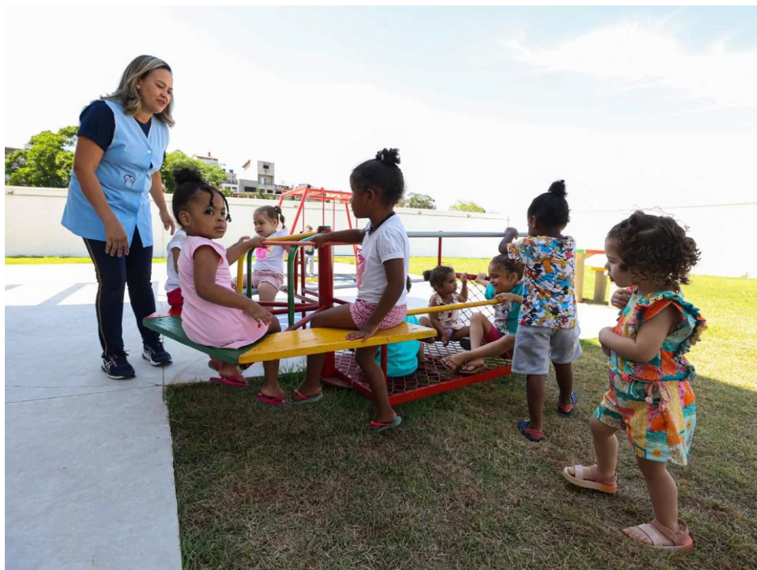
Em 2020, a Prefeitura de São Paulo zerou a fila de creches pela primeira vez na história, situação que se mantém até hoje

Atualmente, também possui mais de 350 mil crianças de 0 a 3 anos matriculadas nos