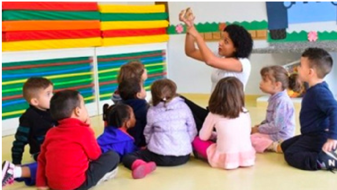
Além da vaga, os alunos recebem créditos para aquisição de uniforme escolar

Na cidade de São Paulo, existem cinco tipos de unidades públicas destinadas à educação infantil, confira ao lado para qual público destina-se cada uma delas: