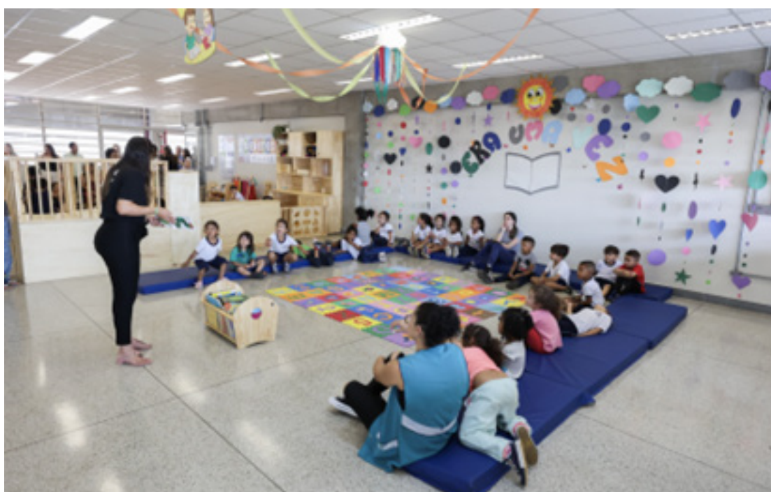
As inscrições tanto para alunos quanto para profissionais da educação já estão abertas

Ações de esporte, lazer, recreação e passeios fazem parte da programação do Recreio nas Férias, que funciona das 9h às 16h para as crianças a partir de 4 anos. Além das atividades, são oferecidas três refeições diárias: café