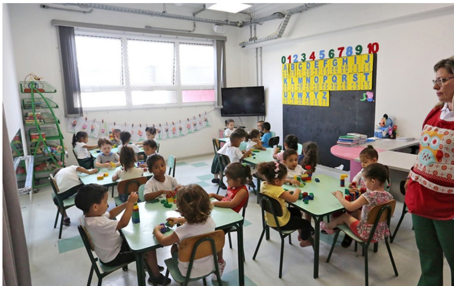
A eliminação da fila de espera por vaga em creche é um marco significativo da Prefeitura de São Paulo

A eliminação da fila de espera por vaga em creche é um marco significativo da Prefeitura, mas também para toda a sociedade, já que isso mostra um avanço no caminho para assegurar os direitos das crianças de terem igualdade de oportunidades desde os primeiros anos de vida.