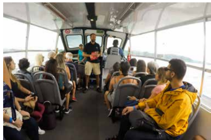
O programa gratuito da Prefeitura conta com uma série de passeios guiados pela cidade em pontos turísticos estratégicos

Para participar de um dos roteiros, é preciso fazer a reserva antecipada, na pla-