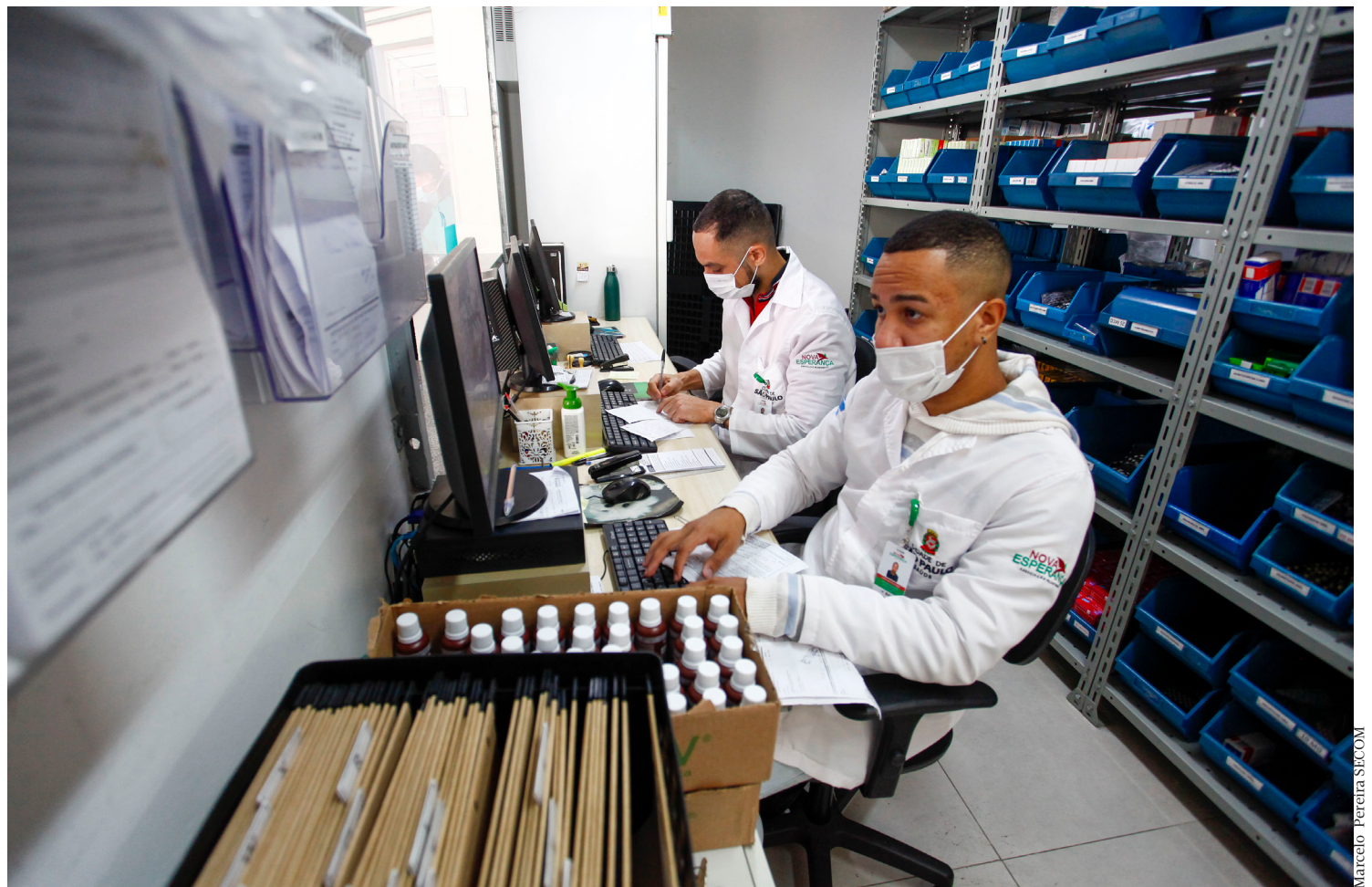
Com uma equipe completa para o melhor atendimento possível, existem 470 UBSs ao todo, espalhadas por todos os bairros de São Paulo

No local, são realizadas cirurgias agendadas (eletivas) e cuidados para gestantes, como o parto. As unidades hospitalares contam também com assistência multiprofissional aos