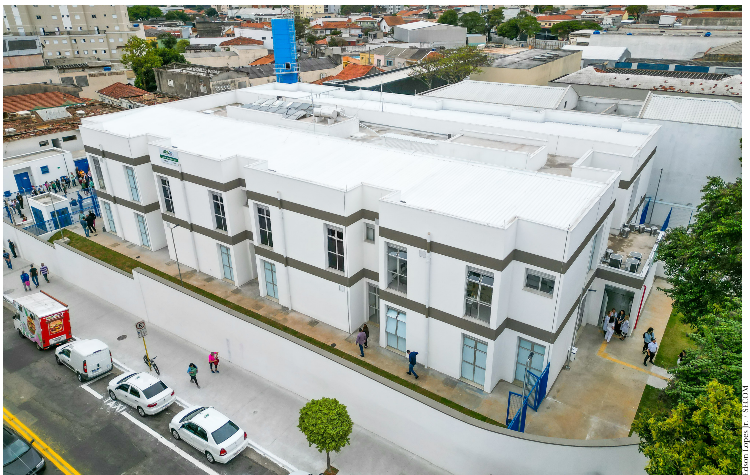
Todos os cidadãos têm direito a usar todos os serviços e equipamentos de saúde disponibilizados pela Prefeitura de São Paulo; saiba mais

Cada um dos municípios da capital paulista possui uma UBS de referência para atendimento e acompanhamento. São 470 UBSs ao todo, espalhadas por todos os bairros da cidade, que oferecem atendimentos de saúde individual e voltados às famílias, por meio do programa Estratégia Saúde da Família (ESF) . O projeto atua na realização