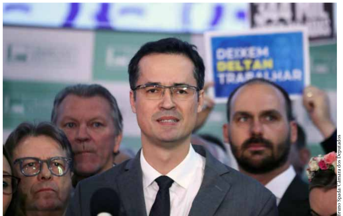
Bruno Spada/Câmara dos Deputados

O julgamento iniciou em plenário virtual e seguirá até o dia 14 de setembro. Se mais um dos sete ministros do TSE votar pela rejeição do recurso, é formada maioria contra o pedido da defesa. A modalidade possibilita que os ministros depositem seus votos de forma on-line e não há debate.