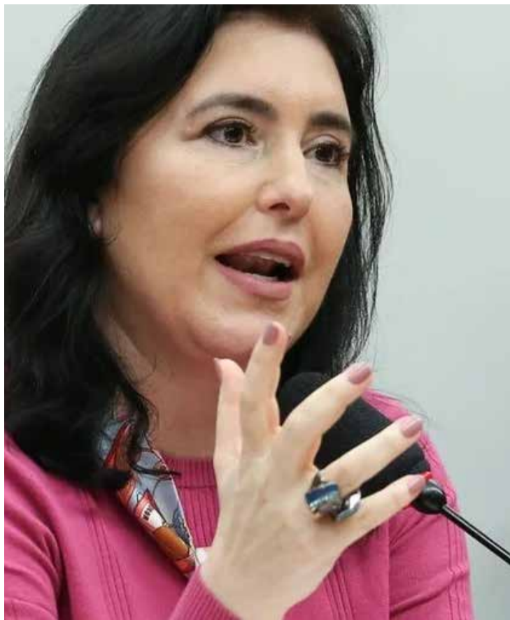
Lula Marques / Agência Brasil

Ministra afirmou que Banco Central não terá “desculpas” para não reduzir os juros após a aprovação do arcabouço fiscal