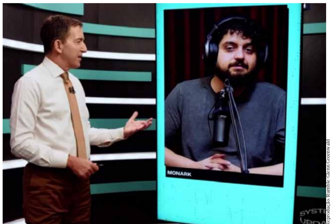
Reprodução: Rumble/Glenn Greenwald

Tanto Glenn Greenwald quanto Musk defendem que a liberdade de expressão deve ser irrestrita. Identificado com a esquerda no Brasil e casado com um político do PDT (o ex-deputado federal David Miranda), o jornalista esteve no centro das atenções quando liderou o Intercept durante a série de reportagens que ficou conhecida como Vaza Jato. Greenwald e sua equipe tiveram acessos a conversas do Telegram entre o ex-juiz Sergio Moro e os procuradores da Operação Lava Jato. O STF decidiu que Moro agiu com parcialidade nas ações contra Luiz Inácio