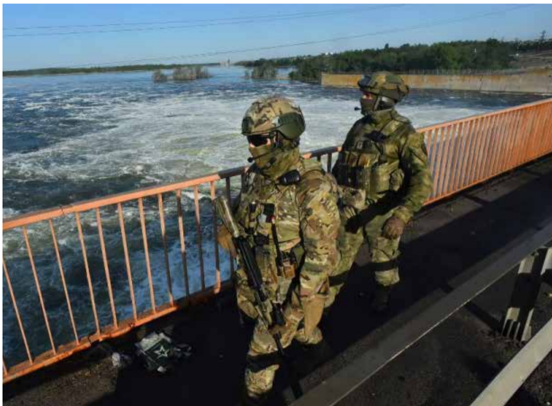
Daniel Leal / Afp

russos (...) o inimigo lançou nove mísseis, realizou três ataques aéreos e disparou 40 projéteis”, disse o Ministério da Defesa ucraniano em um comunicado. A pasta informou ainda que a infraestrutura civil foi afetada. Putin havia declarado o cessar-fogo de 36 horas para permitir a comemoração do Natal pelos cristãos ortodoxos, que celebram a data em 7 de janeiro na Rússia e na Ucrânia. Entretanto, jornalistas de Kiev constataram poucos sinais de que os combates tenham diminuído. O Ministério da Defesa russo insistiu que os combates cessaram, embora admitam terem repellido diversos ataques ucranianos. Por sua vez, a Ucrânia denunciou o cessar-fogo como uma tática de Putin para reagrupar tropas e reforçar suas defesas.