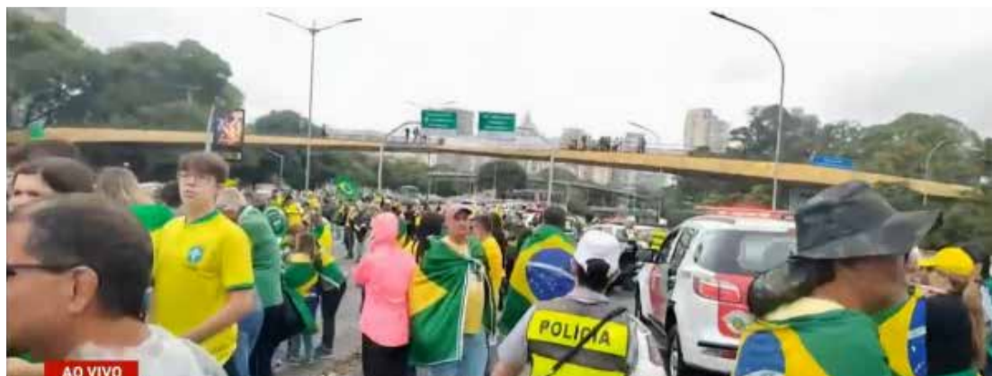
Isac Nobrega / PR

sília, e tem outros atos de protesto pelo país. Além da saída do presidente empossado no dia 1º, os manifestantes pedem intervenção militar. A Tropa de Choque foi acionada. Na noite de sábado o ponto de parada foi em frente ao Aeroporto de Congonhas. Neste domingo os manifestantes se reúnem em frente ao Parque Ibirapuera.