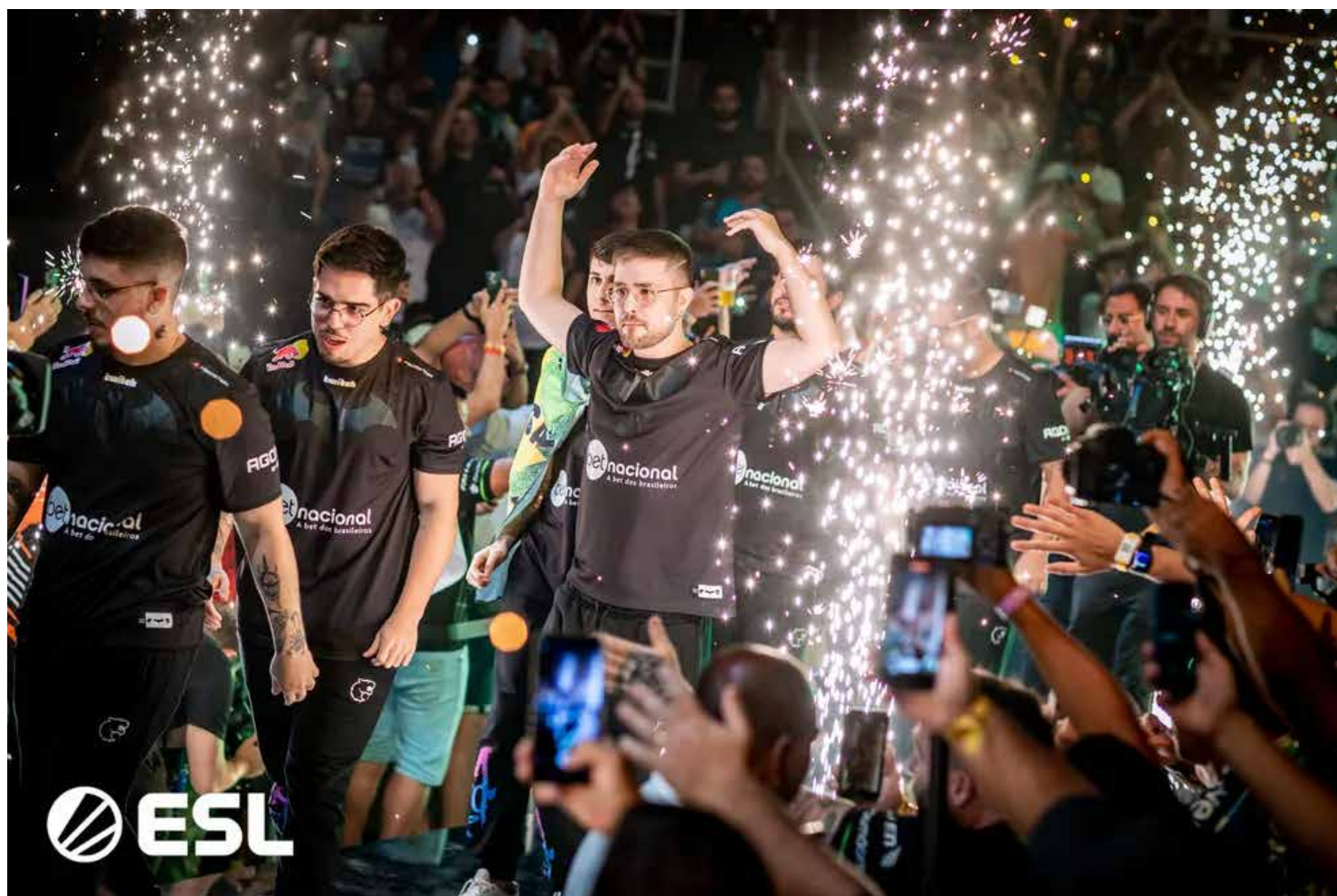
FURIA superou a NaVi de virada para garantir vaga na semifinal

Mapa 1 (Nuke) Após a FURIA levar o primeiro pistol da série, as três rodadas seguintes foram dominadas por rounds forçados ou econômicos. NaVi forçou para cima do armado dos brasileiros e até viraram o marcador, mas os brasileiros conseguiram segurar algumas armas para chegar ao empate em 2-2. No 5º round, a FURIA devolveu a virada e conquistou uma estabilidade financeira para buscar o 5-2 no marcador. Foi quando Valerii “b1t” Vakhovskiy encontrou um clutch 1v2 em um econômico crucial para colocar a NaVi de volta no jogo. A FURIA perdeu um pouco