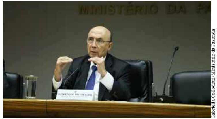
Gabriela Colodetti/Ministério da Fazenda

Por fim, Meirelles pediu que o governo Lula procure facilitar a vida dos empreendedores no Brasil, além de defender o investimento