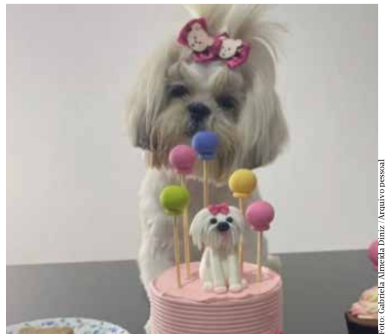
Pandora completou um ano de idade com direito a festa

“Meus remédios, que eu tomo todos os dias, não estão dando conta. Estou tendo que tomar mais um para me acalmar para conseguir dormir. Estou com crises de pânico. A Pandora é minha companheira de tudo, não sei explicar em palavras o quanto eu a amo. Meu coração dói, sangra”, lamenta.