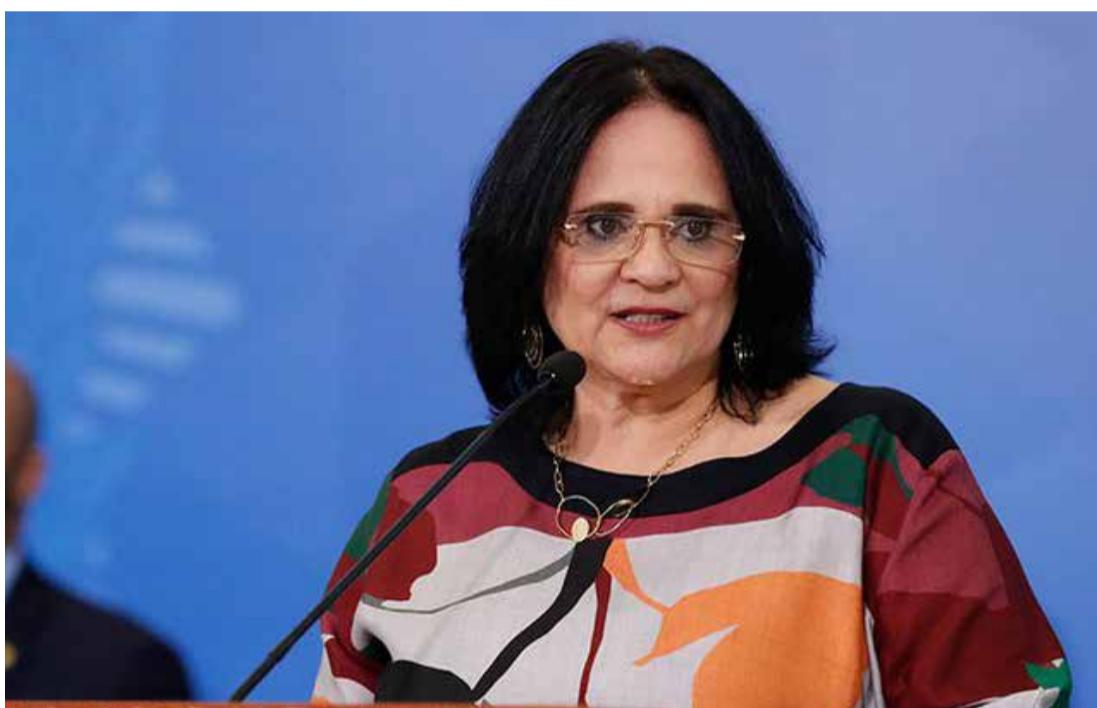
Goiás estão previstas outras duas unidades, uma em Ja- taí, no sudoeste do estado, e outra em Cidade Ocidental, perto do Distrito Federal, ao custo de R$ 800 mil cada.

te corajoso. Macho. Pois chegou. Acabou. Nós vamos enfrentar os agressores", apontou. Ainda durante o encontro, Dameres falou sobre o projeto Casa da Mulher Brasileira, alegando que se trata de uma forma de acolher as mulheres em um centro em que encontrem diversos serviços, como assistência contra a violência doméstica. No espaço também funcionará uma defensoria, promotoria, um alojamento provisório, cela para os agressores e um espaço para crianças. "Estamos trazendo hoje R$ 10 milhões para a construção, em Goiânia, da Casa da Mulher Brasileira. O terreno foi doado pela prefeitura e o governo federal está construindo. Não é só um prédio, é uma política", afirmou. Além da inaugurada, em