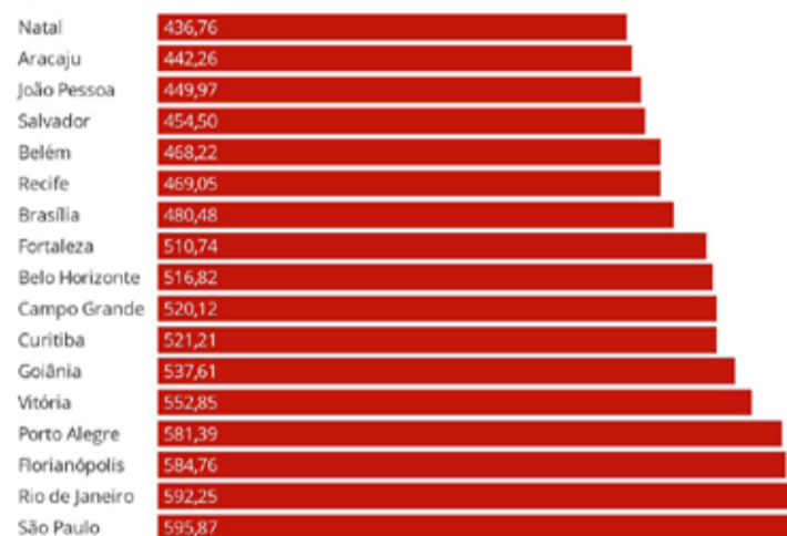
Gráfico: EconomiaG1