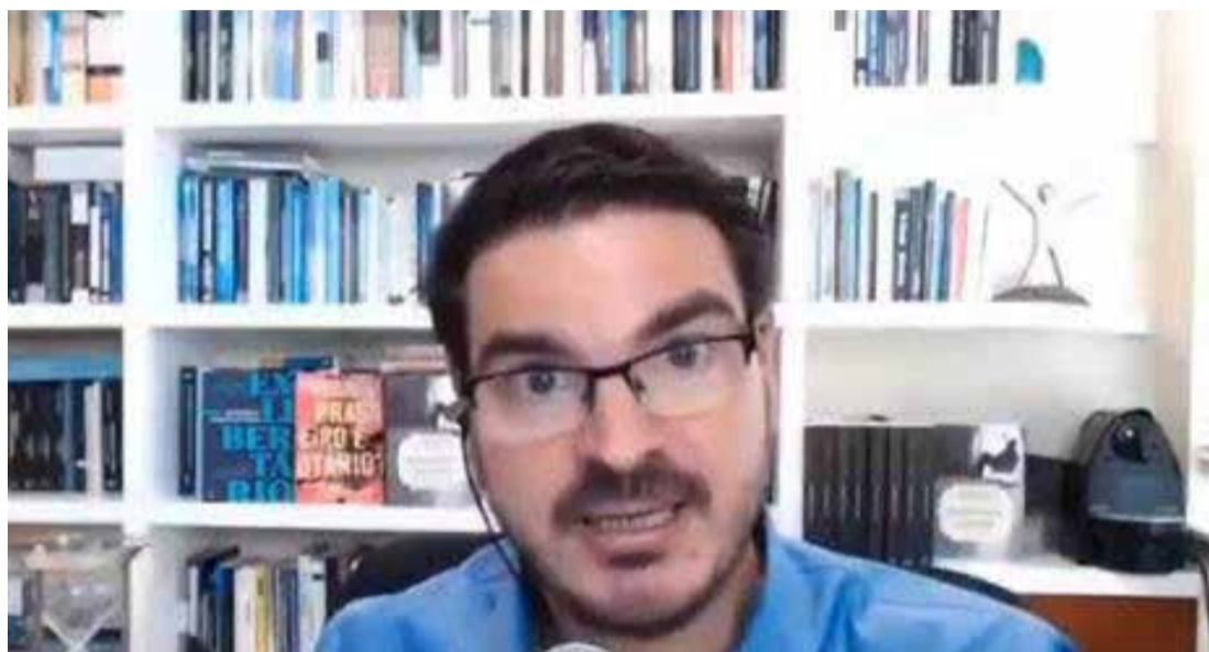
Rodrigo Constantino em live com o Jornal Diário de São Paulo

Em seu comentário, Constantino disse que se sua filha fosse estuprada nas circunstâncias da influencer, ele a colocaria de castigo. “Ela vai ficar de castigo feio, eu não vou denunciar um cara desses para a polícia, eu vou dar esporro na minha filha, que alguma coisa