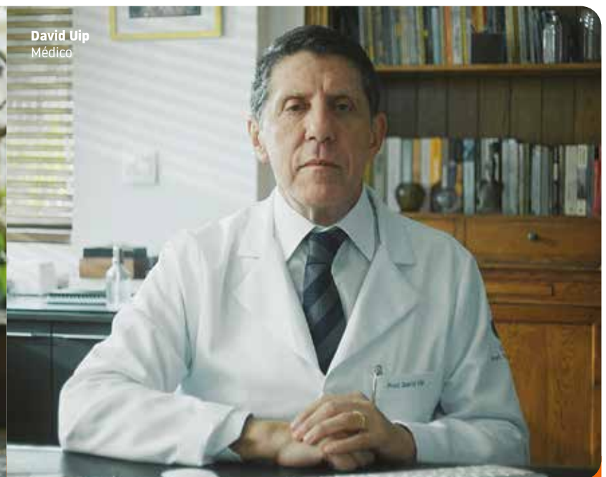
David Uip Médico

Continue se cuidando. Se sair, use máscara.