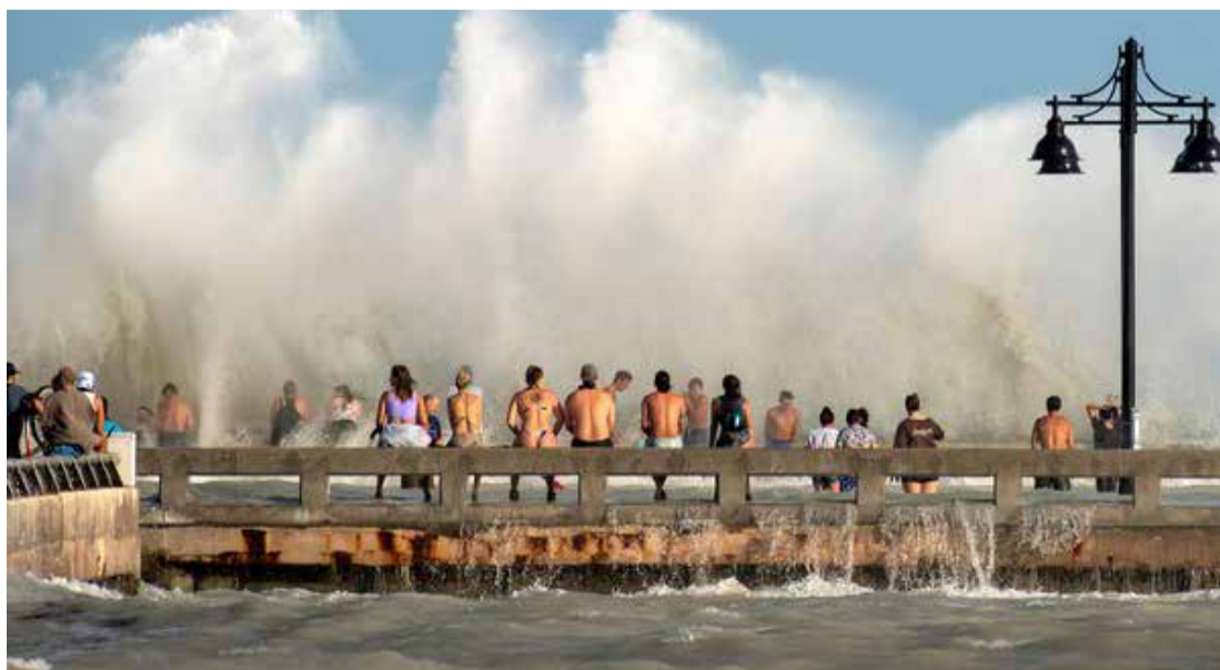
Grupo se reúne na segunda-feira (24) em píer na Flórida, nos EUA, para observar o mar revolto por causa da aproximação da tempestade Laura