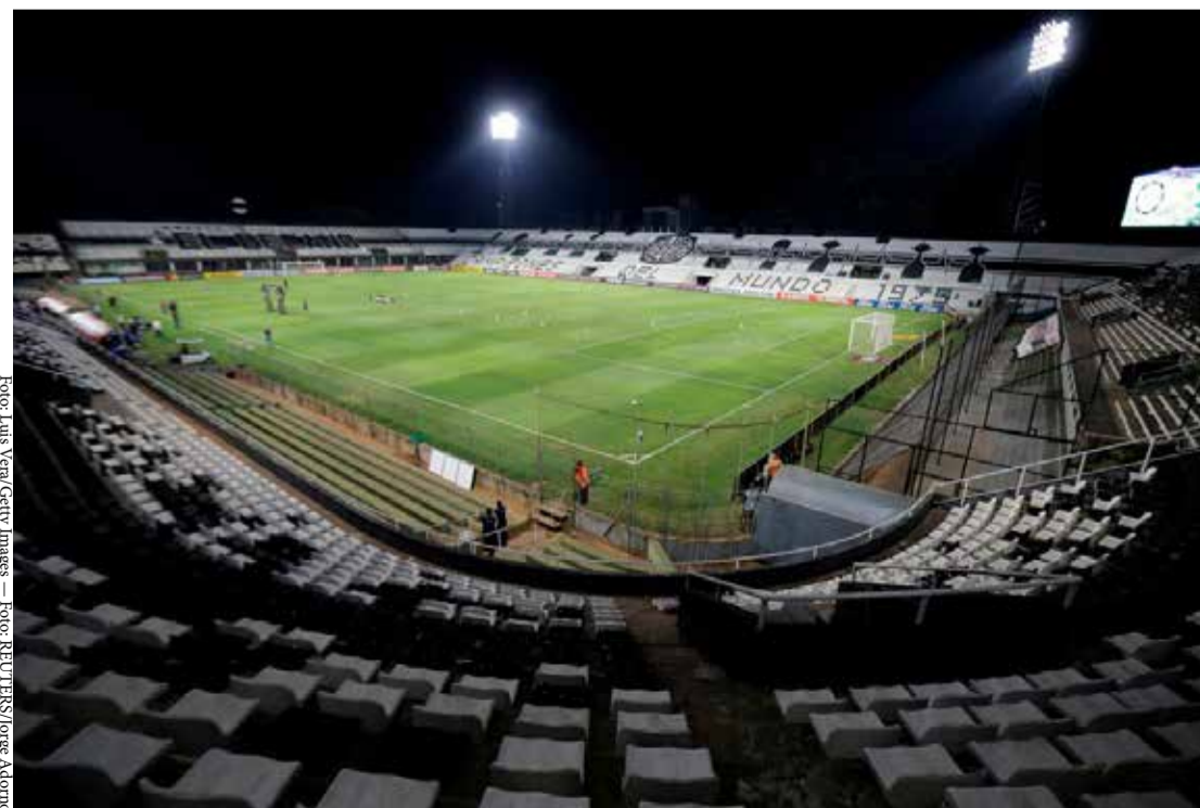
Partida entre Defensa y Justicia e Olimpia foi com portões fechados