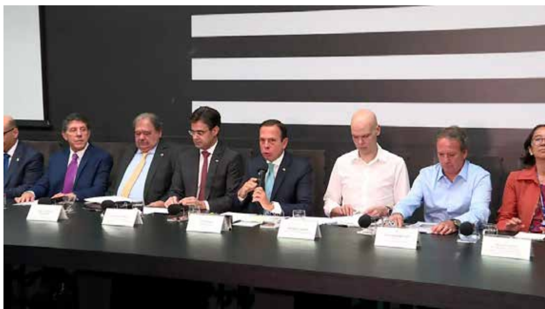
O governador de São Paulo João Dória e o prefeito Bruno Covas realizam entrevista coletiva sobre o novo coronavírus nesta quinta

Segundo o médico ainda não é recomendado cancelar eventos e aglomerações. “Estas medidas não são aplicáveis hoje, mas não significa que não serão aplicáveis amanhã. Mas não tem sentido você fechar o estado porque você tem 46 casos. pode ser que amanhã as medidas sejam total-