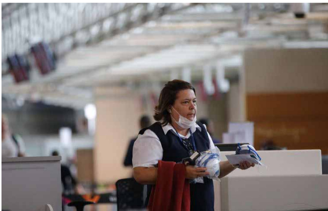
Passageiros e funcionários circulam vestindo máscaras contra o novo coronavírus (Covid-19) no Aeroporto Internacional Tom Jobim - Rio Galeão

Procedimento similar já foi adotado em relação aos laboratórios para realizarem os exames para coronavírus. Inicialmente, o