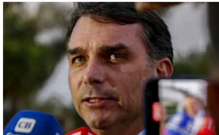
Bruno Peres / Agência Brasil

A defesa de Valdemar Costa Neto, emitiu um pronunciamento também nesta sexta se declarando surpresa com a decisão do ministro do STF Flávio Dino, que determina o bloqueio de R$ 119,2 milhões em bens por