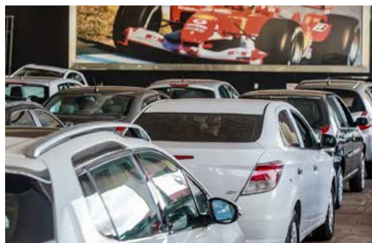
Kaia Neddermeyer / Agência Brasil

Apoio a extensão de longo prazo da moratória da Organização Mundial do Comércio (OMC) sobre a isenção de imposto de