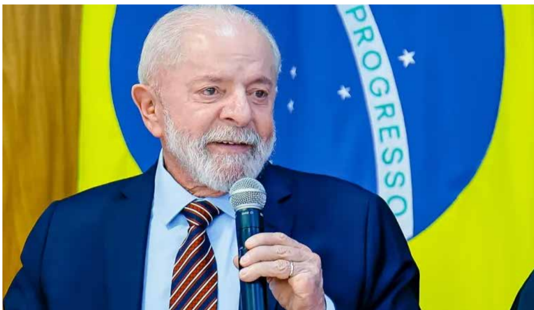
Ricardo Stuckert / PR

A ideia do governo era reduzir gradualmente a