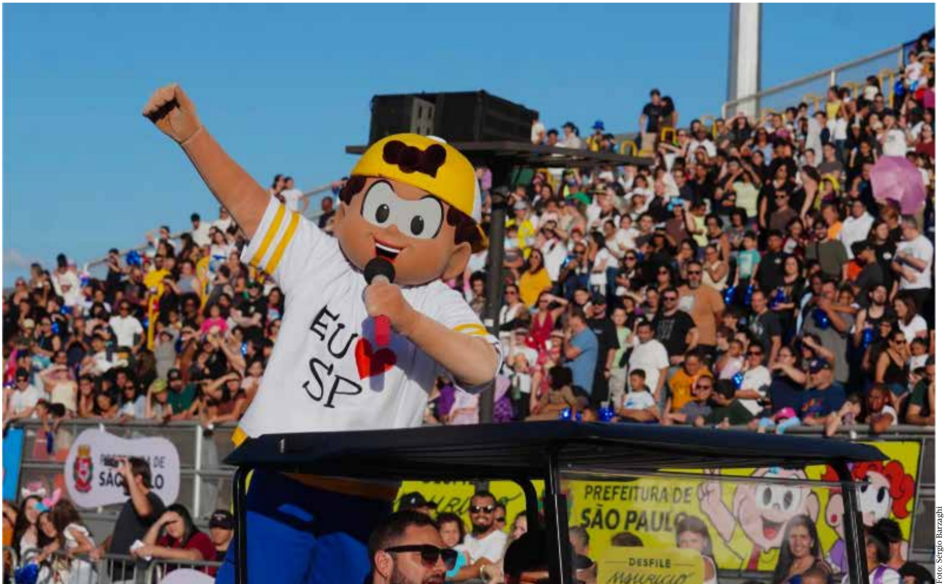
Personagem Paulistinha foi criado por Mauricio de Sousa em homenagem à cidade de São Paulo

A iniciativa inclui oficinas gratuitas, mostra em diferentes regiões da capital e a distribuição de mais de 22 mil gibis e 800 livros por meio da rede municipal de bibliotecas