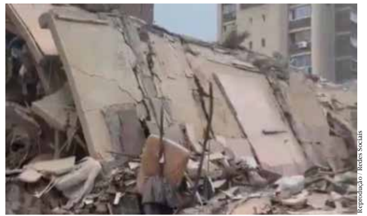
Reprodução / Redes Sociais

Países como Estados Unidos, China, Brasil,