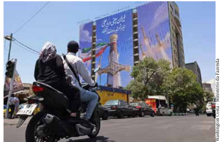
Washington Costa / Ministério da Fazenda

De acordo com o deputado, o tema tem recebido apoio de parlamentares, integrantes da equipe econômica e do presidente da Câmara, Hugo Motta (Republicanos-PB).