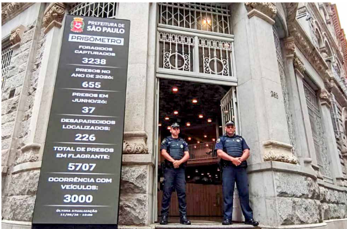
Painel do Prisômetro no centro de São Paulo: sistema do Smart Sampa utiliza tecnologia de leitura automática de placas para apoiar o trabalho das equipes de segurança

Um dos casos recentes que levou ao marco foi a localização de uma motocicleta com registro de furto. A identificação ocorreu a partir da leitura automática de placa, com verificação em banco de dados integrado, o que permitiu confirmar a irregularidade e encaminhar o veículo para registro em unidade policial. Após a ocorrência, o bem foi devolvido ao proprietário.