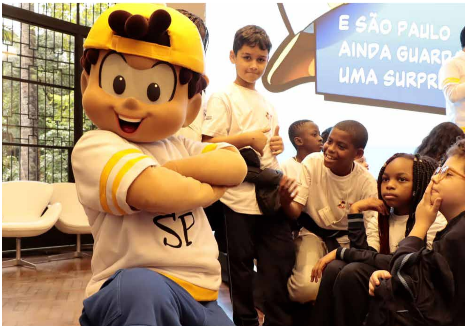
Criado por Mauricio de Sousa, Paulistinha é o mascote oficial de São Paulo e simboliza a relação do autor com a cidade

A agenda especial ganhou ainda mais visibilidade após a apresentação do Paulistinha, mascote oficial da cidade. Criado por Mauricio de Sousa como uma homenagem à capital paulista, o personagem passa a representar o espírito da cidade e integra diversas ações previstas para o aniversário do autor, cuja obra foi reconhecida neste ano como patrimônio cultural imaterial de São Paulo.