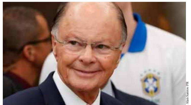
Alan Santos / PR

tamento dos sigilos bancário e fiscal dos investigados, incluindo Macedo, além do sequestro e bloqueio de bens e valores de até R$ 670.348.945,70. Segundo a Polícia Federal, durante as investigações foram analisados relatórios produzidos pelo Banco Central do Brasil que apontaram graves irregularidades na condução dos negócios pelos administradores da instituição financeira. Os investigados poderão responder, na medida de suas responsabilidades, pelos crimes de gestão fraudulenta, inserção de dados falsos em demonstrativos contábeis e realização de operações de crédito vedadas, previstos na Lei nº 7.492/1986, que define os crimes contra o Sistema Financeiro Nacional. Em nota, a corretora ID CTVM, que é citada na operação, informou que, “sente-se no dever de esclarecer que a corretora adota rigorosos padrões