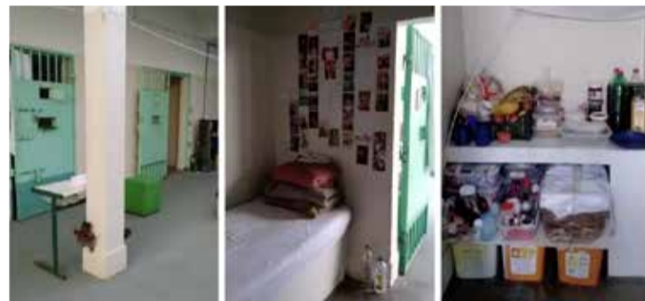
Montagem / Reprodução

cardápio padronizado adotado nas unidades prisionais do estado, elaborado com base em critérios nutricionais e sanitários. Sobre a higiene, o ofício cita a Lei de Execução Penal e afirma que é dever da pessoa presa manter a higiene pessoal e o asseio da cela, habitação ou