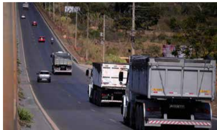
Pedro França / Agência Senado

A proposta altera a forma de cálculo do frete mínimo, que passará a considerar custos operacionais como combustível, manutenção, seguros e