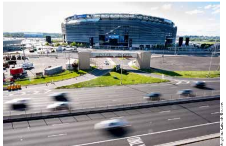
Angelina Kasansky Reuters

profissionais com habilidades consideradas extraordinárias em áreas como artes, esportes, ciência e negócios. Dependendo da situação, o documento permite atividades remuneradas, como campanhas publicitárias, parcerias com marcas e produção de conteúdo comercial. Uma fonte do governo dos EUA disse ao "El País" que a gestão do presidente Donald Trump pretende reforçar a fiscalização em aeroportos e postos de fronteira para identificar influenciadores estrangeiros que utilizam vistos de turista para trabalhar e gerar receita. Segundo a fonte, que falou sob condição de anonimato, o objetivo é "proteger empregos americanos". "Eles mesmos se denunciam por meio dos vídeos", afirmou a fonte, referindo-se a criadores de conteúdo que compartilham nas redes sociais detalhes sobre a obtenção de vistos e viagens pelos Estados Unidos para produzir material para plataformas