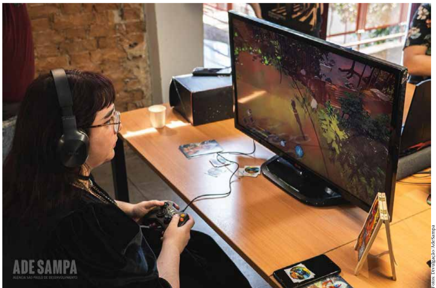
Iniciativa contempla projetos de jogos digitais, realidade virtual, realidade aumentada e experiências imersivas

Para concorrer a uma das vagas, os empreendimentos devem estar em funcionamento e